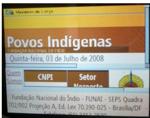
Figura 4 – Homepage da FUNAI com estrutura em frames inacessível em disp. móvel.

Os resultados mais inacessíveis vieram das páginas que haviam aplicado ao site uma estrutura em frames . Por exemplo, não foi possível acessar as informações da homepage da FUNAI, nem navegar pelo site a partir de um dispositivo móvel. (Figura 4). Assim como na homepage da Auditoria Interna do Ministério Público da União, que durante os testes só carregou as informações contidas no frame rodapé (figura 5).