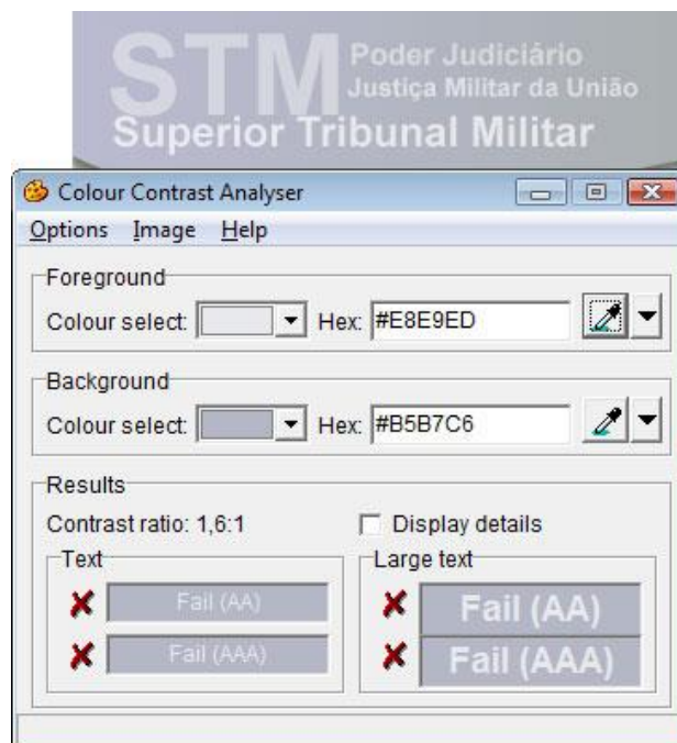
Figura 2 – teste de contraste na homepage do Superior Tribunal Militar.