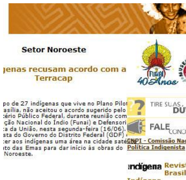
Figura 3 – Parte do teste de impressão da Homepage da FUNAI com textos inacessíveis.

Das catorze homepages analisadas, apenas duas foram classificadas com “boa qualidade” de impressão: a página inicial do BNDES e do Ministério das Relações Exteriores . Dez outras páginas foram classificadas com “baixa qualidade” e duas como “inacessíveis”, pois deixaram de imprimir áreas relevantes do conteúdo ou com textos inacessíveis a leitura, conforme figura 3.